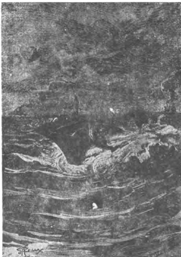
چگونه از کوه بالا رفتند

در تمام امریکا نظایر آن یافت میشد و آبها را، سگهای چمن نام گذاشته بودند .