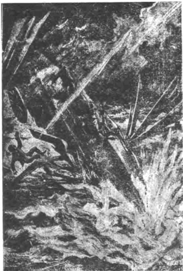
در ساحل رودخانه

نقطه‌ای در حرکت است فقط این مطلب را اداره پلیس میدانست که بایستی