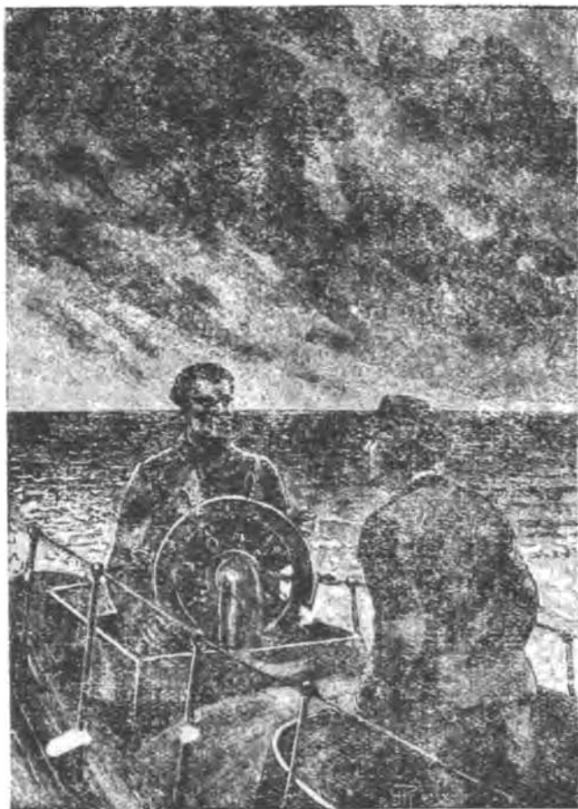
در کشتی ابوانت

مرا نیز مانند سایرین در ساحل رودخانه گذاشته حرکت کند این بهتر بود که بی جهت با غرق کردن من خودش رازحمت بدهد . در هر حال از جا بلند شدم و خود را پشت سرش قرار دادم و ایستادم