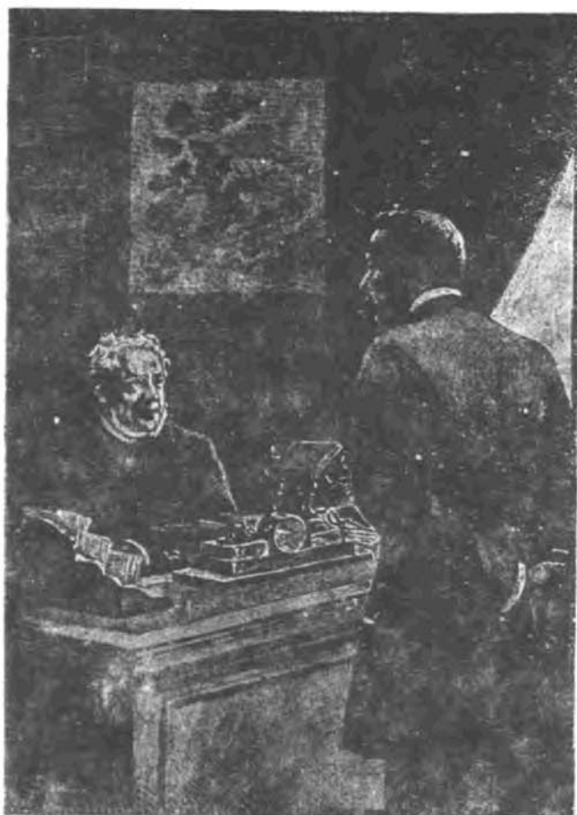
استورک در اداره پلیس

– بوسیله نامه یا تلگراف مرا در جریان کارهای خود بگذارید