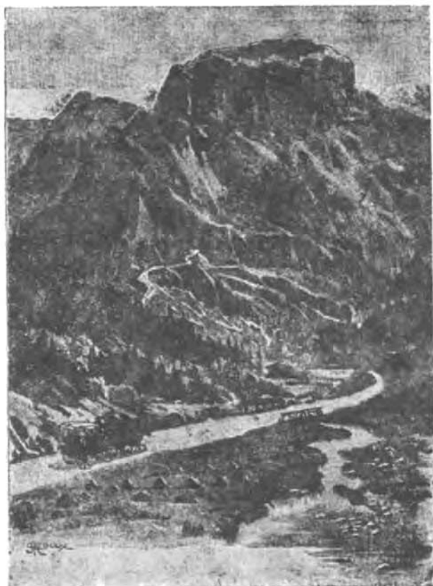
کوه غول عظیم

احتیاط از هر گونه خوردنی که عبارت از دو قطعه ژامبون و ران خوک و گوشت گوسفند و چند بطری آبجو و چندین شیشه ویسکی و بمقدار کافی